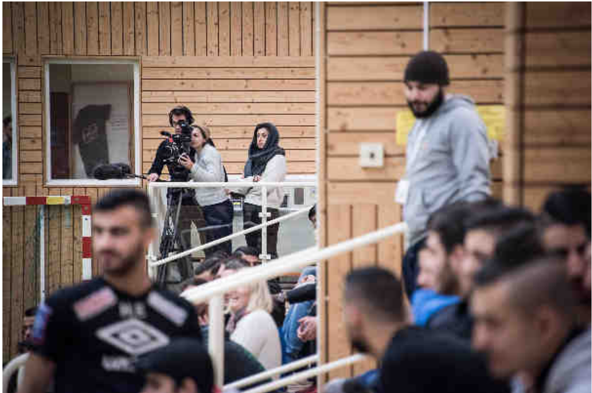
Konst händer Holma, 2018