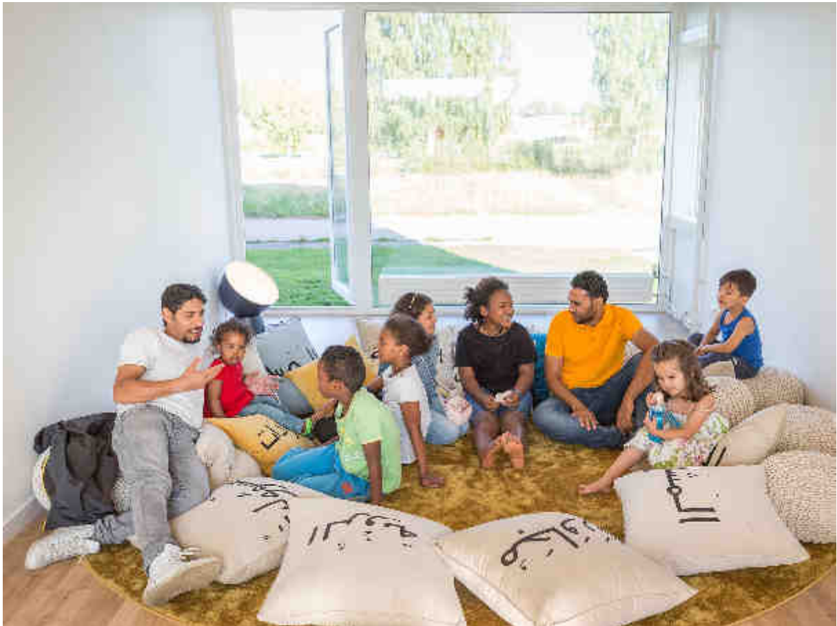
Konst händer Prästholmen, 2018