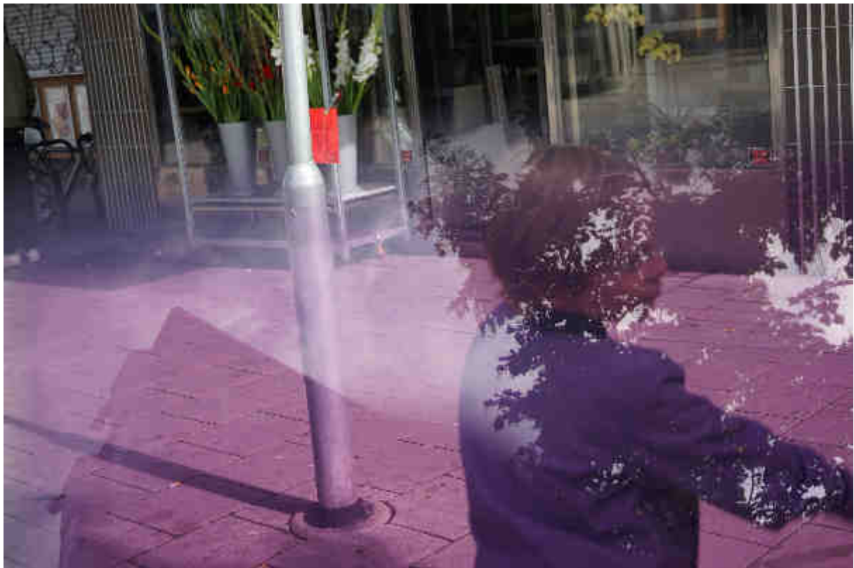
Konst händer Råslätt, 2018

Mer jämlika miljöer stod på olika sätt i fokus i Hammarkullen, Råslätt och Tynnered. Projekten synliggjorde behovet av att ta del av stadsrummet för grupper som med befintlig planering inte givet kunde det, eller som av någon anledning förlorat tillgången till stadsrummet och ville kämpa för att få den åter.