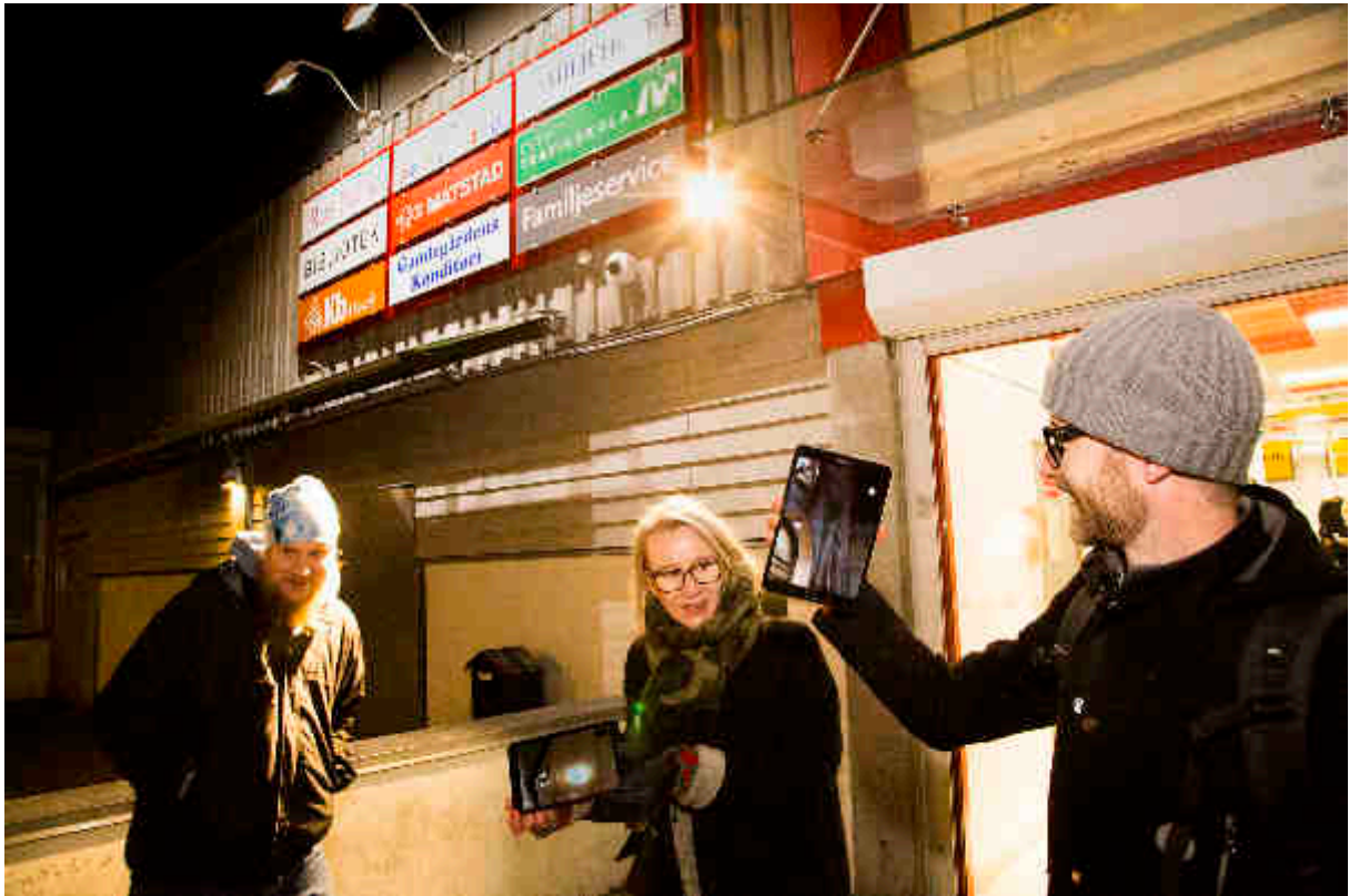
Konst händer Gamlegården, 2018