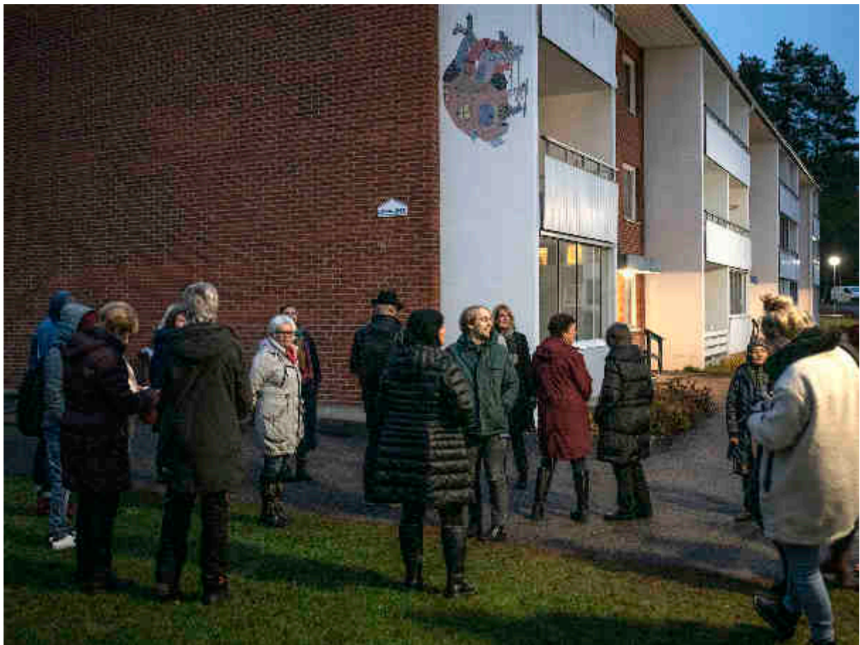
Konst händer Gärdeåsen, 2018

Viljan att synliggöra för att därmed stärka sitt bostadsområdes befintliga sociala och fysiska värden (människorna i området, lugn, trygghet, grönska), eller återupprätta värden som gått förlorade, var särskilt viktiga i till exempel Gärdeåsen, Tjärna ängar och Tynnered.