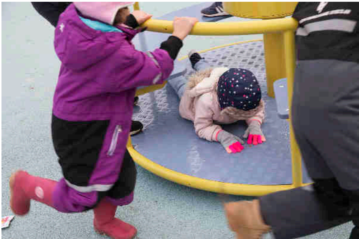
Konst händer Lindängen, 2018

mötesplats i särskilt fokus. Frågan var också central för projektet Konst händer Nävertorp som ingick i Konst händer fördjupade förundersökningsfas.