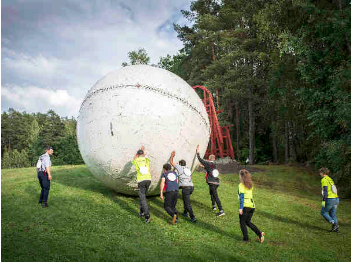
Konst händer Råby, 2018